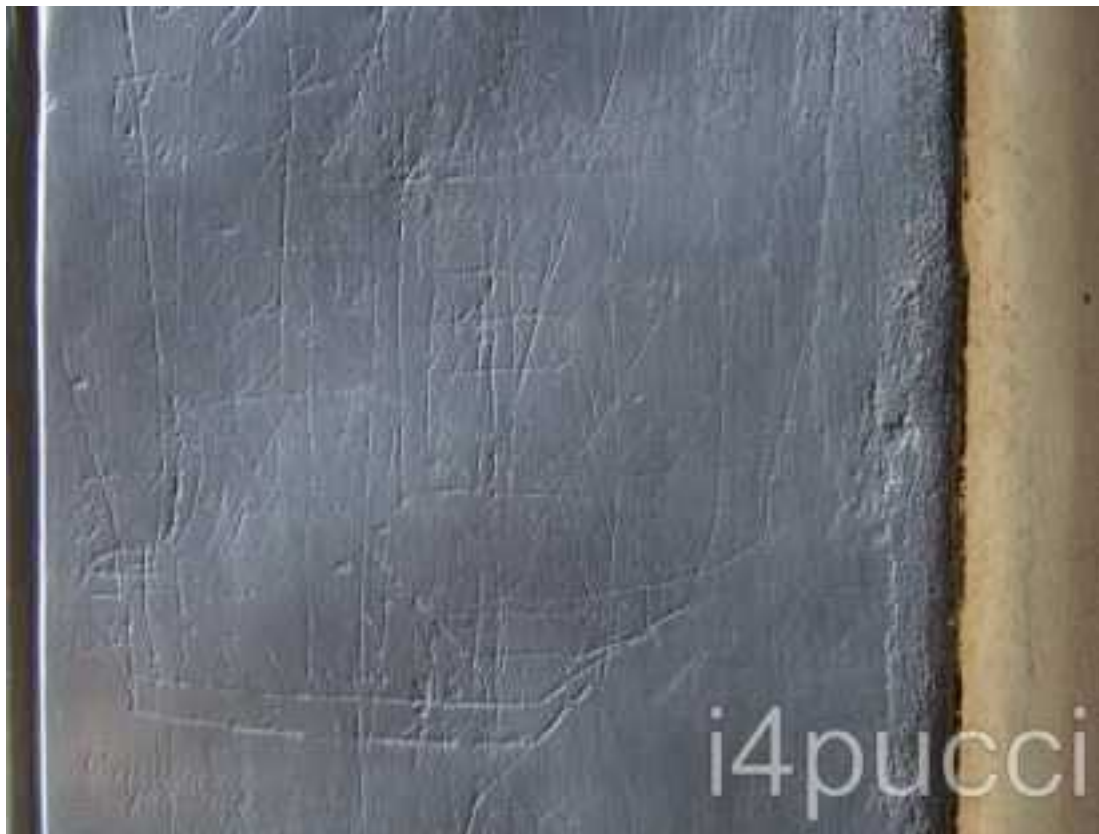
Graffito di pinco genovese armato con vele quadre sugli alberi di maestra e trinchetto.