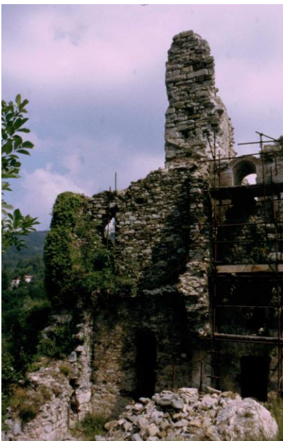
Il castello oggi (a sinistra) ed il corridoio alla base della torre col concio in oggetto (a destra)