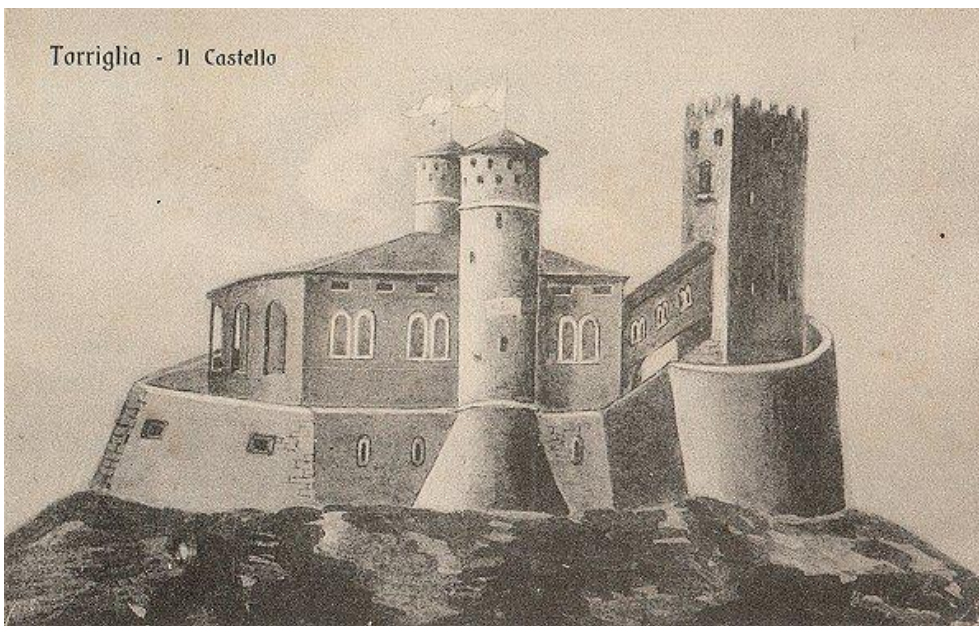
Il castello secondo un'ipotetica ricostruzione