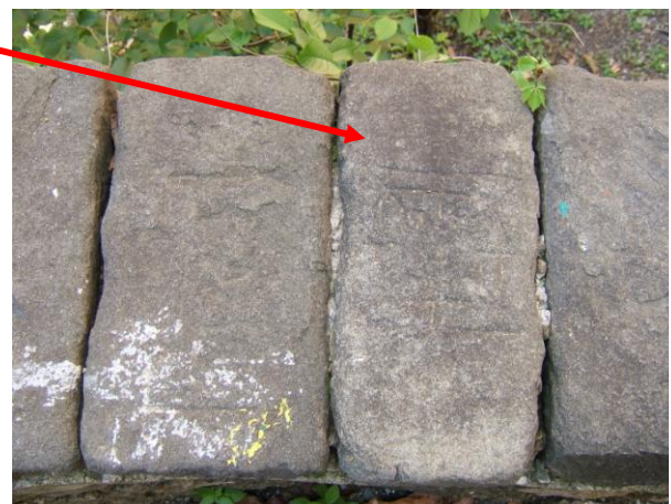
Filetto con diagonali (16x16 cm).