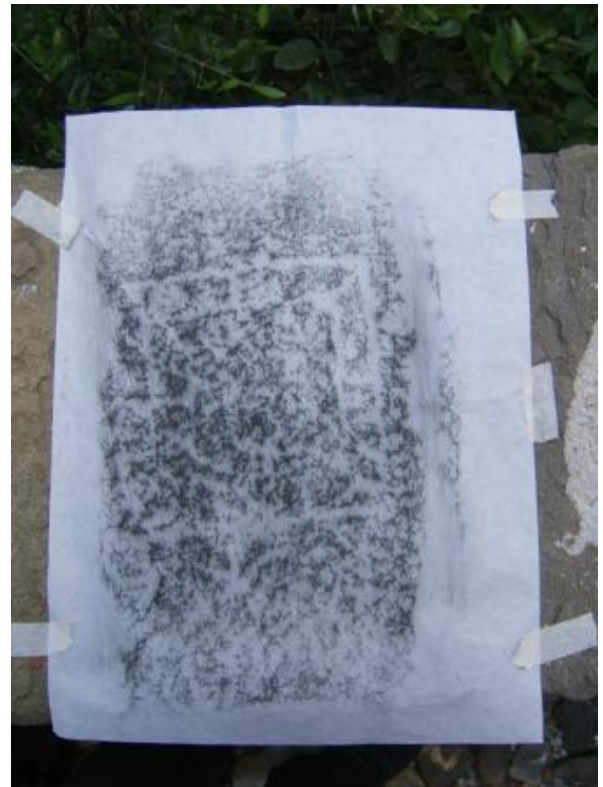
Filetto con diagonali (18x20 cm).