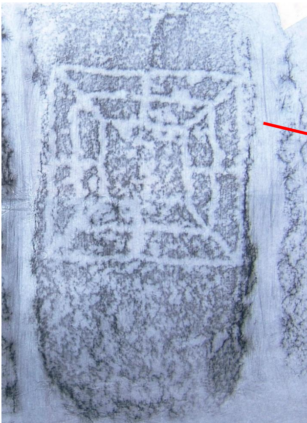
Frottage del filetto indicato nell'immagine a fianco.