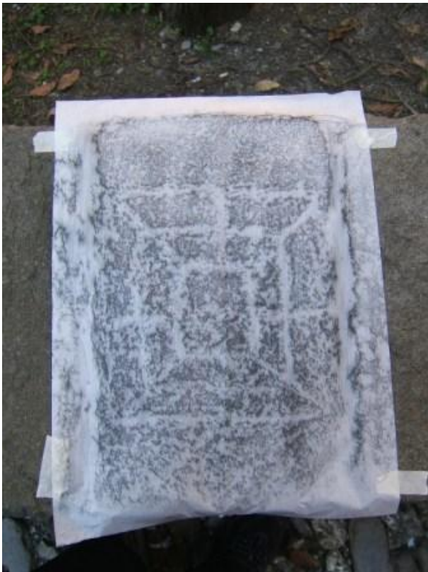
Filetto con diagonali (24x25 cm).