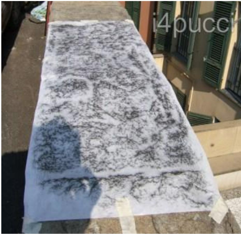
Coppia di filetti molto degradati. Poco più avanti una probabile seconda coppia ormai praticamente illeggibile.