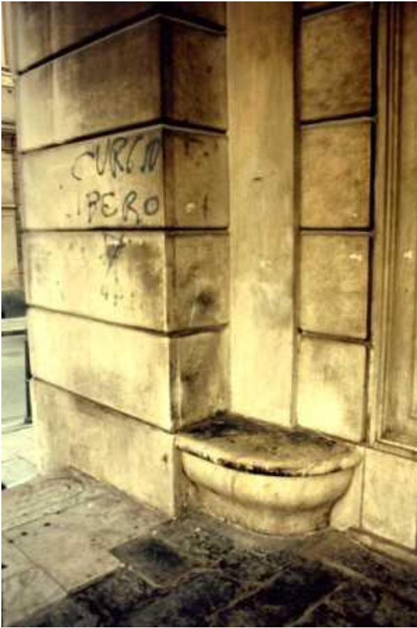
Sedile in marmo lato Via S. Lorenzo.