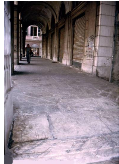
Il porticato sotto la facciata.

Su una lastra di marmo del pavimento sita nell'angolo destro sono incise due figure: la prima, ben conservata, è un filetto con diagonali (lato 10x11 cm) molto piccolo ed al limite della giocabilità. La seconda è una figura quadra (lato 21x23 cm) più un semiquadro interno; si tratta quasi certamente di un altro filetto incompiuto.