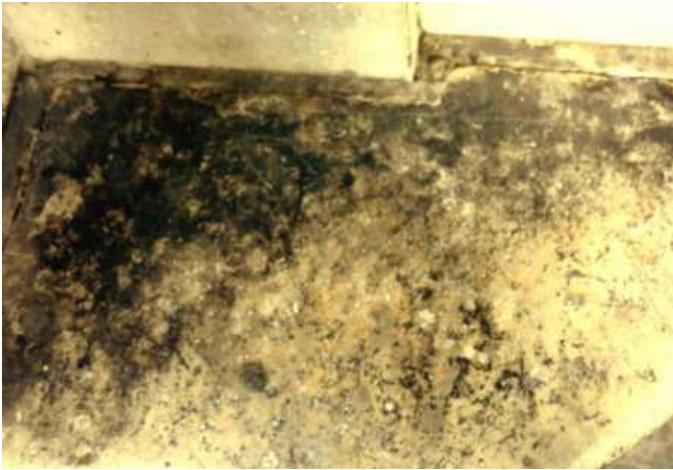
Si nota lo stato del sedile.

Su uno dei quattro sedili in marmo posti ai quattro angoli del porticato, e precisamente il sinistro lato mare, è stata tracciata una figura geometrica solo apparentemente interpretabile come una scacchiera; il tutto è malamente conservato e di difficilissima lettura a causa del tratto sottile con cui è stata incisa e dello strato di sporcizia ormai concrezionata.