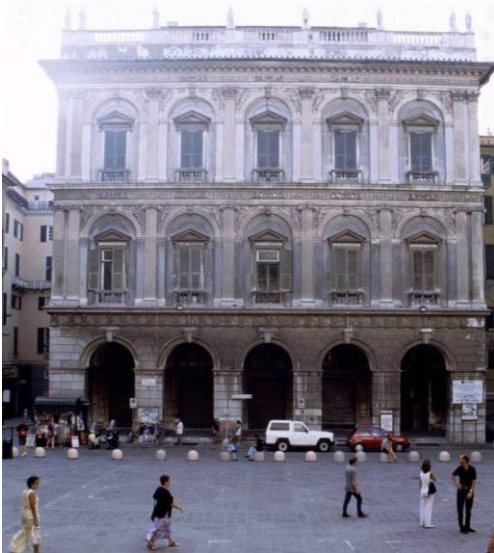
La facciata del palazzo vista dalla scalinata della Cattedrale.

Costruito attorno alla metà del XIX secolo su progetto dell'architetto Tommaso Carpineti seguitamente ai già citati lavori di ampliamento di Piazza San Lorenzo e dell'apertura dell'omonima via. Il lato del palazzo che si affaccia sulla piazza presenta un porticato leggermente sopraelevato.