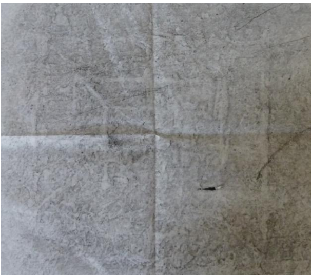
Frottage del filetto della panca destra.

Oltre al naturale degrado cui l'ardesia spesso è soggetta, uno spesso strato di vernice nera ha colmato quasi completamente i solchi uniformando il colore degli stessi a quelli della panca (sia la destra che la sinistra) col risultato di rendere la lettura quanto mai difficile, analogamente per la fotografia ed anche il frottage si rivela scarsamente utile.