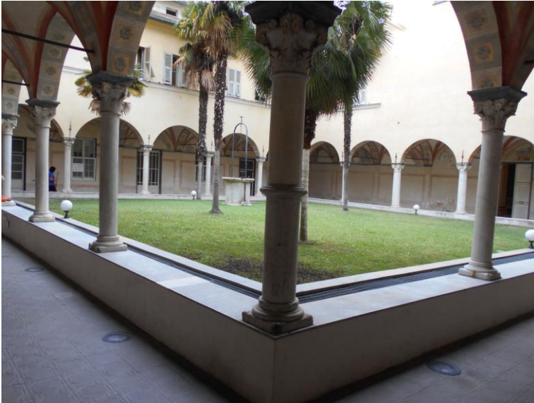
Il Chiostro Grande.

Sul supporto marmoreo su cui poggiano le colonne che circondano il Chiostro Grande è stata incisa una scacchiera.