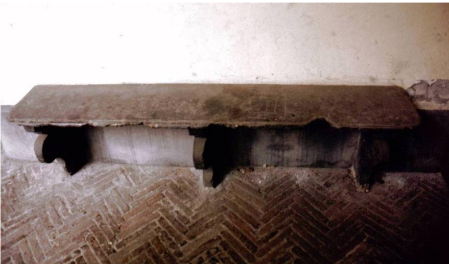
Panca in ardesia