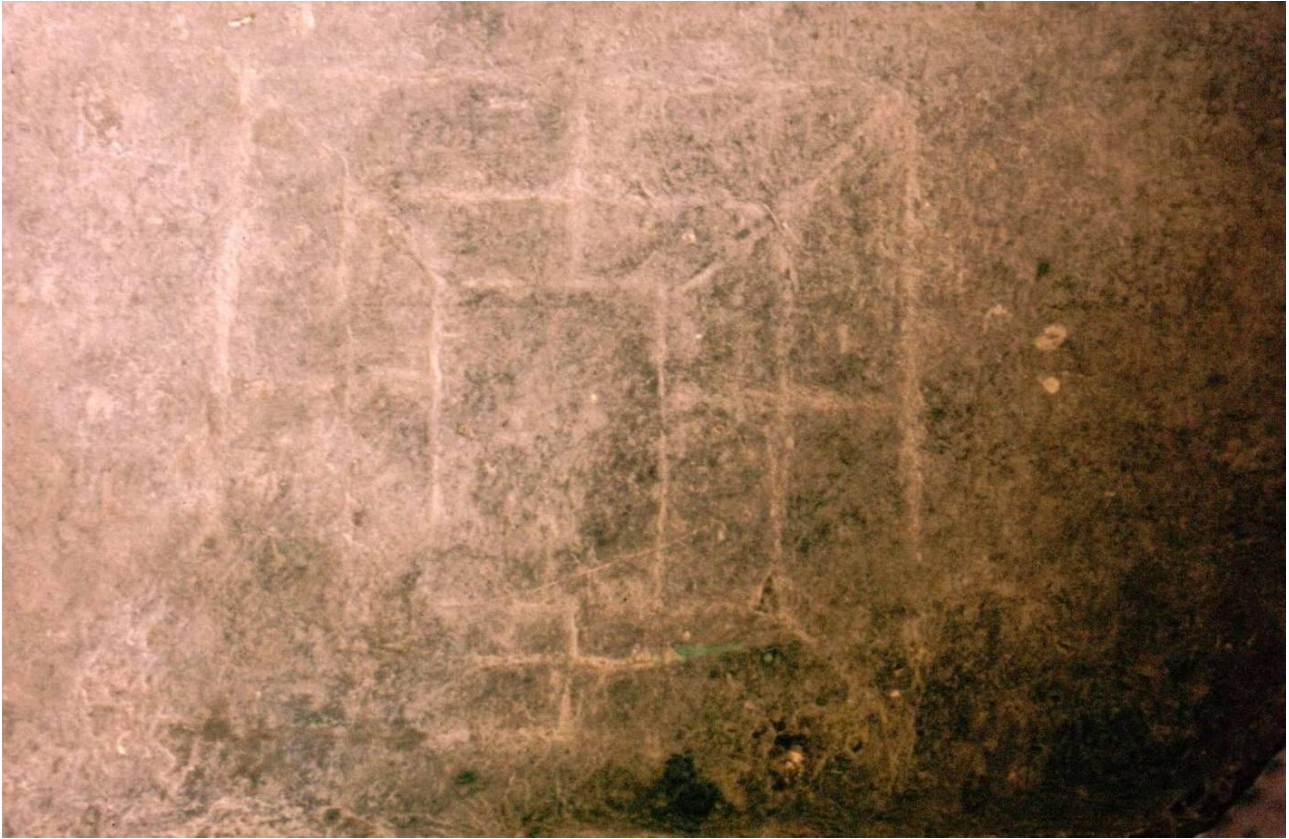
Il filetto della panca destra prima del “restauro”.

Oltre al naturale degrado cui l'ardesia spesso è soggetta, uno spesso strato di vernice nera ha colmato quasi completamente i solchi uniformando il colore degli stessi a quelli della panca (sia la destra che la sinistra) col risultato di rendere la lettura quanto mai difficile, analogamente per la fotografia ed anche il frottage si rivela scarsamente utile.