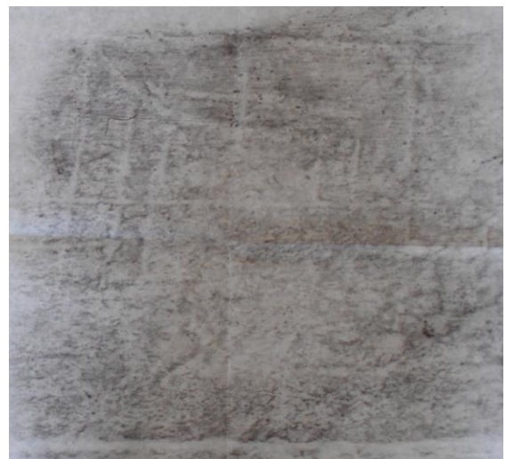
Frottage del filetto della panca sinistra.