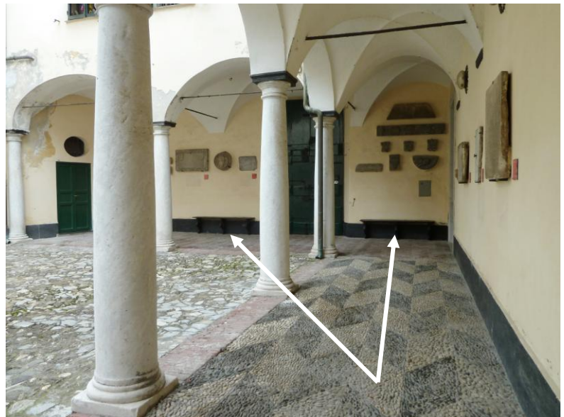
La posizione delle due panche.

Questi filetti non dovrebbero essere anteriori alla fine del 1500, quando Leone X liberalizzò il “gioco”.