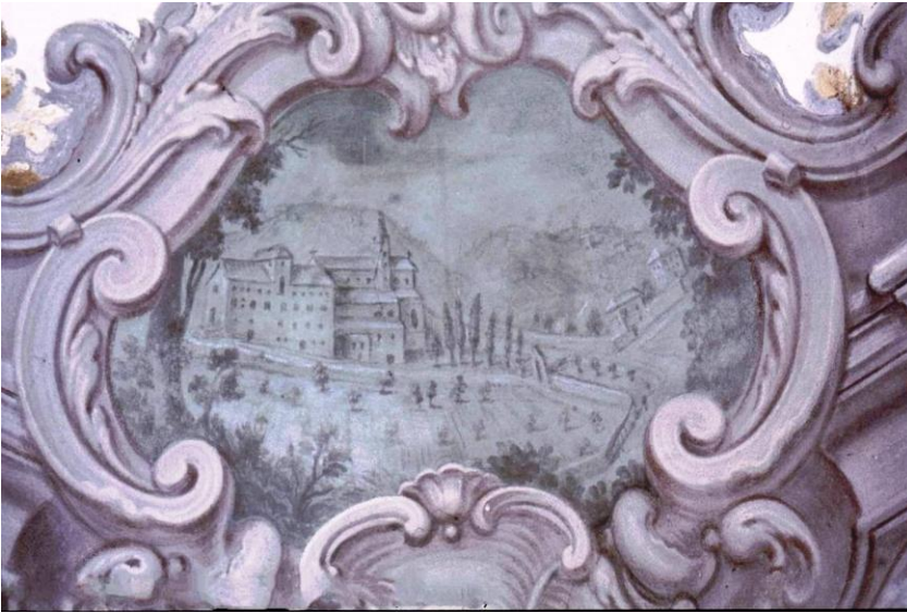
Affresco raffigurante l'Abbazia.

Sul sedile di destra il filetto appare abbastanza leggibile, i lati misurano 23x22 cm ed è munito di diagonali; il filetto del sedile di sinistra (22x22 cm) risulta molto abraso, tuttavia si può osservare che la foggia è del tutto simile al precedente.