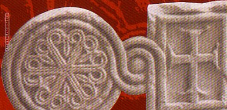
foto: sarcofago di Santa Marta, (particolare), proprietà Congregazione Operai Evangelici Franzoniani